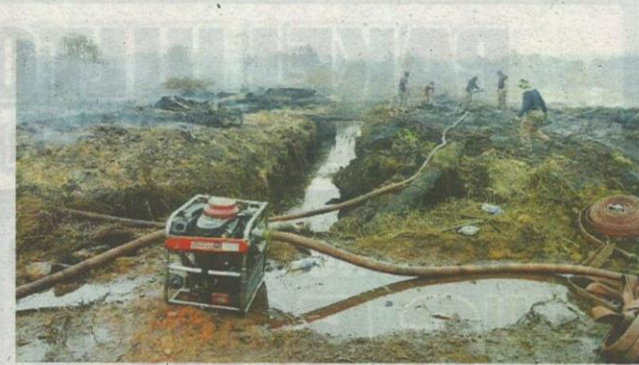
Anggota bomba dan penyelamat serta agensi terlibat bertungkus-lumus memadamkan kebakaran.